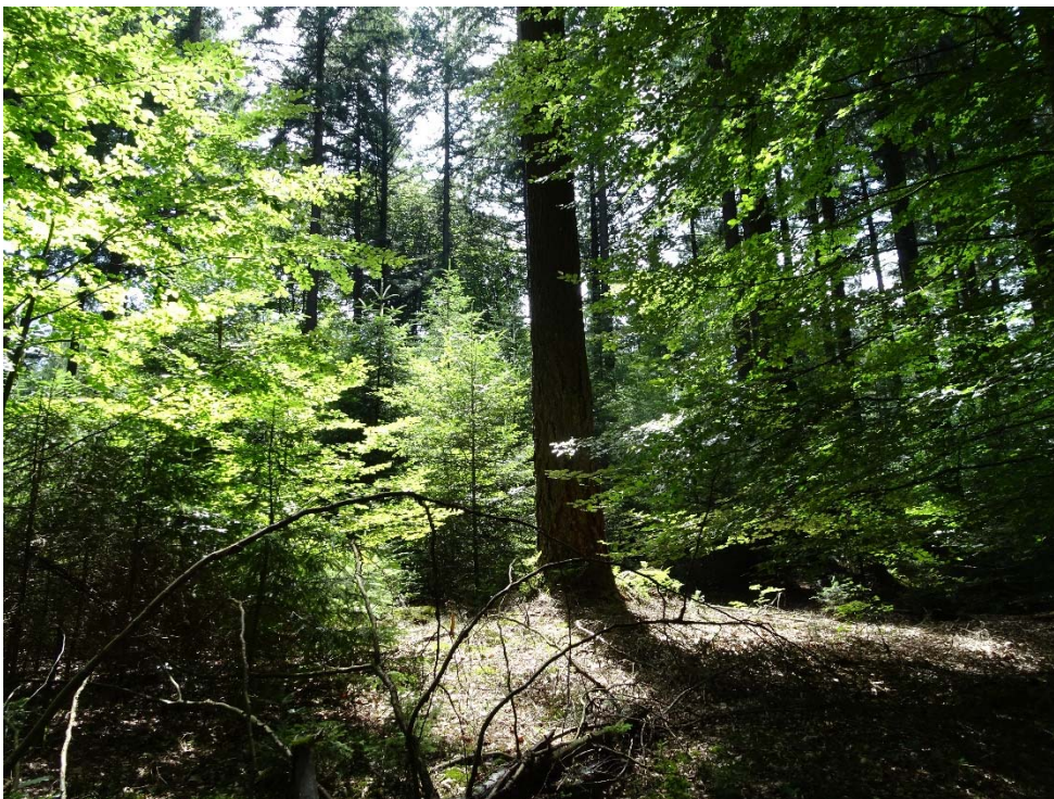
Foto: Neuburgerwald bei Passau