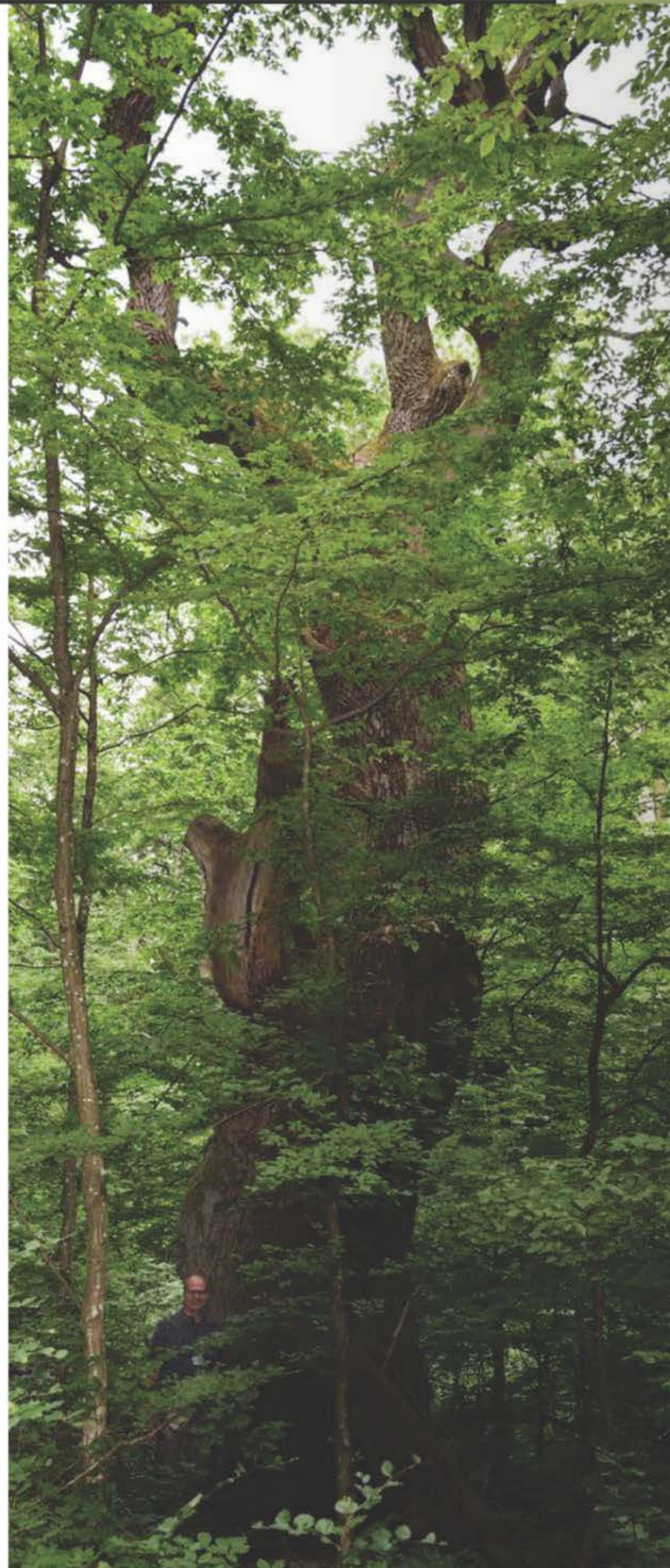
Pro Silva-Veranstaltungen finden so gut wie immer im Wald statt.

Der erweiterte Vorstand wird den Regionen Europas gerecht und wurde darüber hinaus mit erfahrenen Experten aus Wissenschaft, Public Relations und Projekt- und Strategiemanage- →