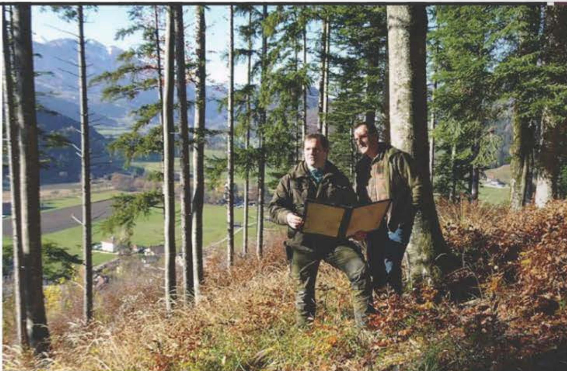
Beratung hilft bei der individuellen Lösungssuche auf der Fläche.

Mitunter sind Modellrechnungen hilfreich: In der Forstökonomie wird unterschieden zwischen der Umtriebszeit des größten Massenertrages und jener des größten Geldertrages. Schließlich gilt es, den Aspekt der Sicherheitsziele einzubeziehen wie etwa die Bedeutung der sicheren Geldanlage. Risiko ist fixer Bestandteil jeder unternehmerischen Tätigkeit. In